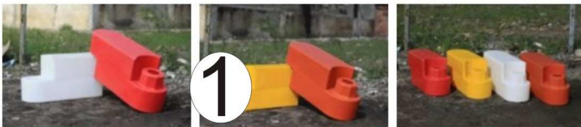
Пластиковые барьеры для гоночных трасс производства «Группы компаний «ЭкоПром».